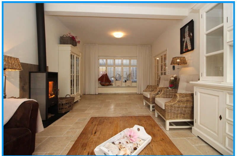
Woonkamer met gladde muren en openslaande deuren naar keuken