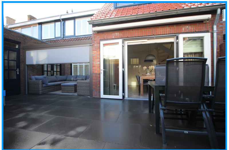
Tuin met sierbestrating en glazen veranda met screens