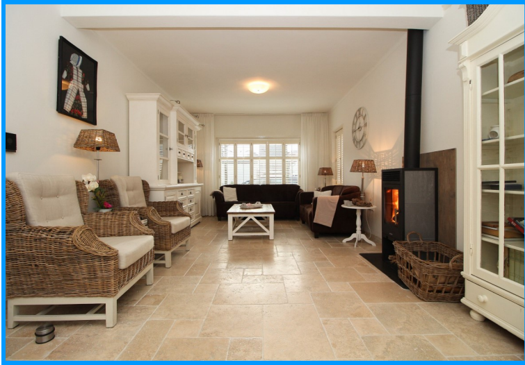
Woonkamer met nieuwe hout gestookte openhaard