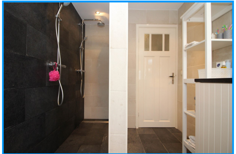
Badkamer met diverse sanitair- re voorzieningen