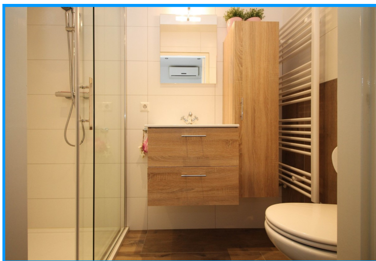
Badkamer met diverse sanitaire voorzieningen