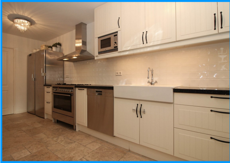
Complete keuken met diverse inbouwapparatuur